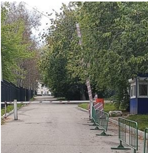
Barrier and Checkpoint