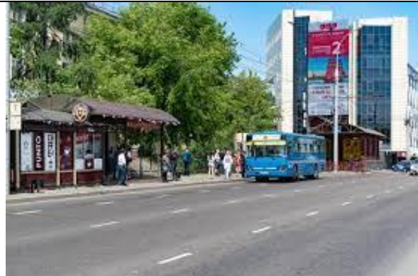
Bus and Trolleybus Stop