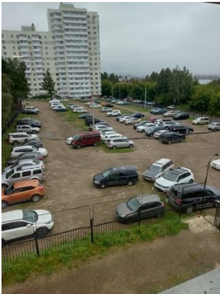
INRTU Parking lot

INRTU pursues the Zero Carbon Policy and the University's Policy for Achieving Sustainable Transport . INRTU annually implements a number of initiatives to decrease private vehicles on campus and prioritise pedestrianisation on campus.