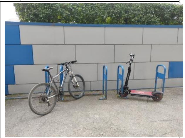
Parking for bicycles, scooters