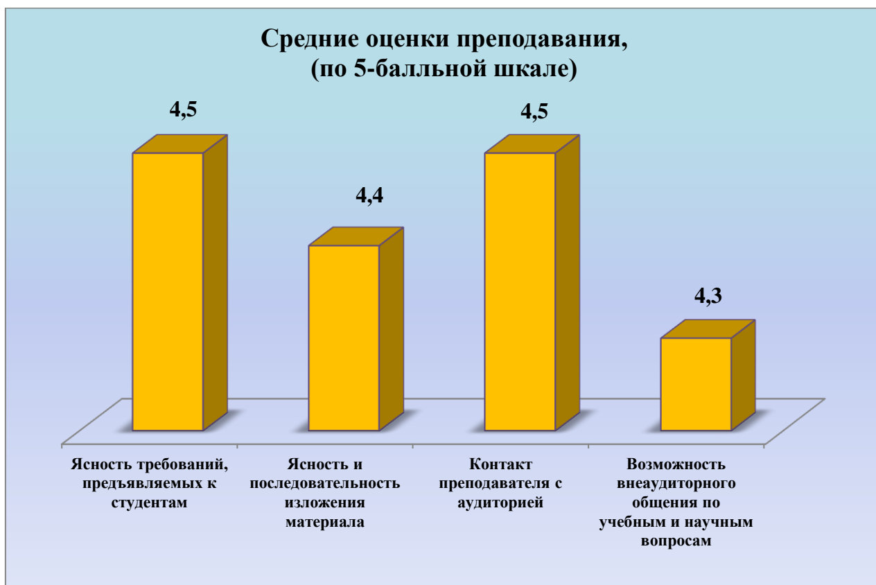
Рисунок 2 – Средние оценки преподавания (по 5-балльной шкале)