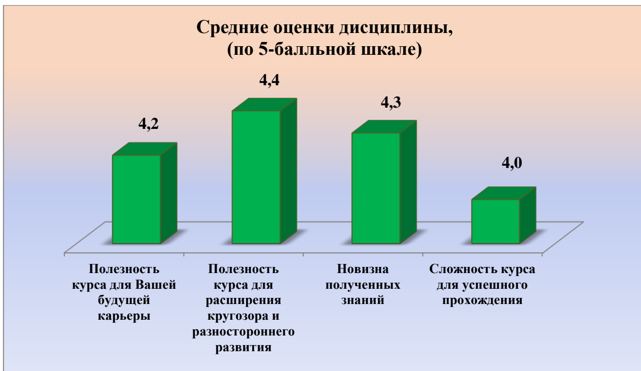
Рисунок 1 – Средние оценки дисциплины (по 5-балльной шкале)