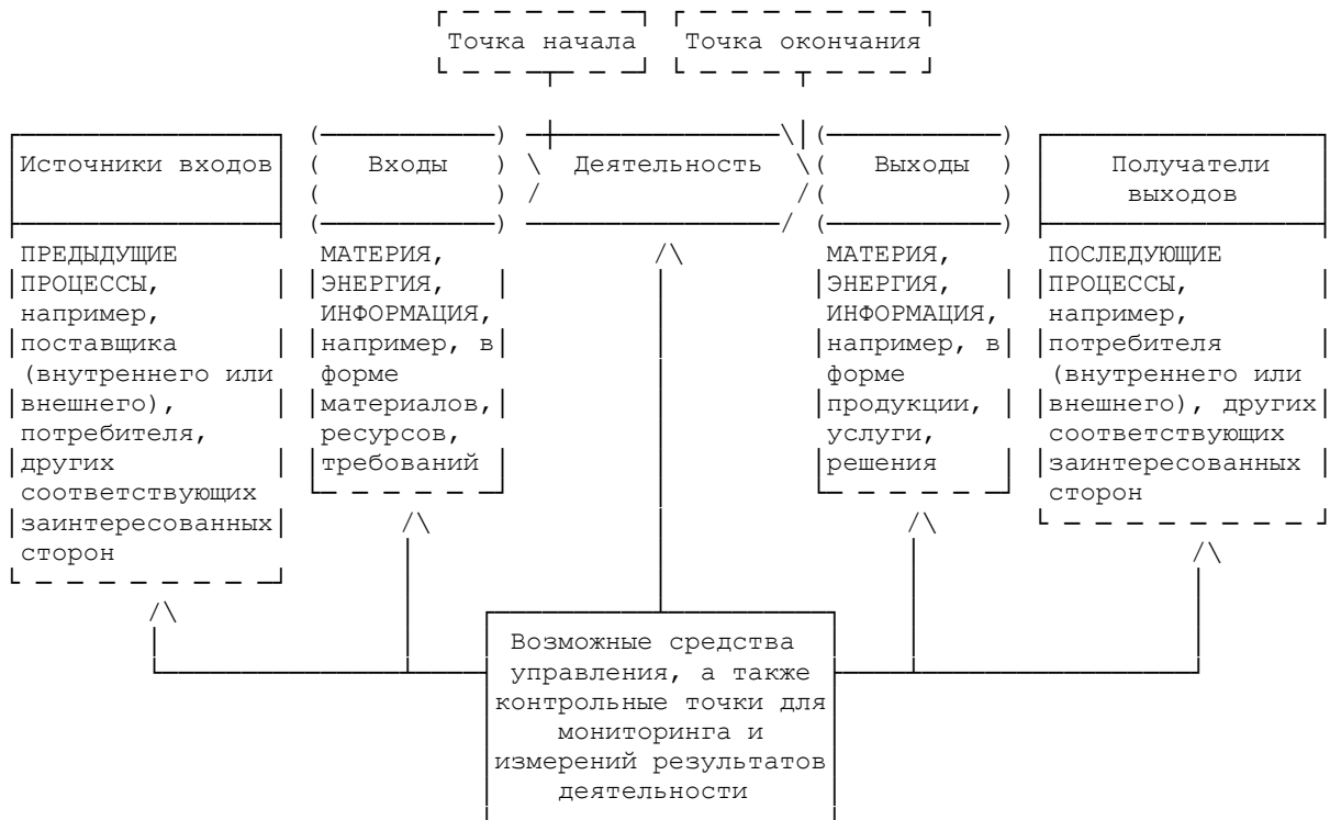
Рисунок 1 - Схематичное изображение элементов процесса

Рисунок 1 дает схематичное изображение любого процесса и иллюстрирует взаимосвязь элементов процесса. Контрольные точки мониторинга и измерения, необходимые для управления, являются специфическими для каждого процесса и будут варьироваться в зависимости от соответствующих рисков.