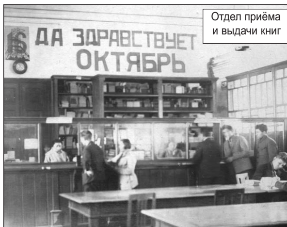
Отдел приёма и выдачи книг