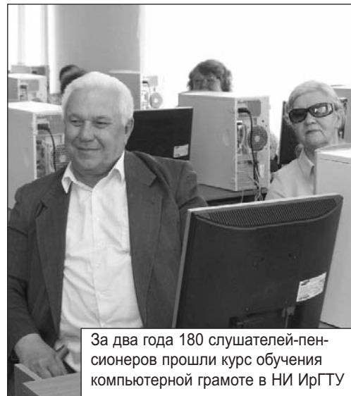
За два года 180 слушателей-пенсионеров прошли курс обучения компьютерной грамоте в НИ ИргТУ