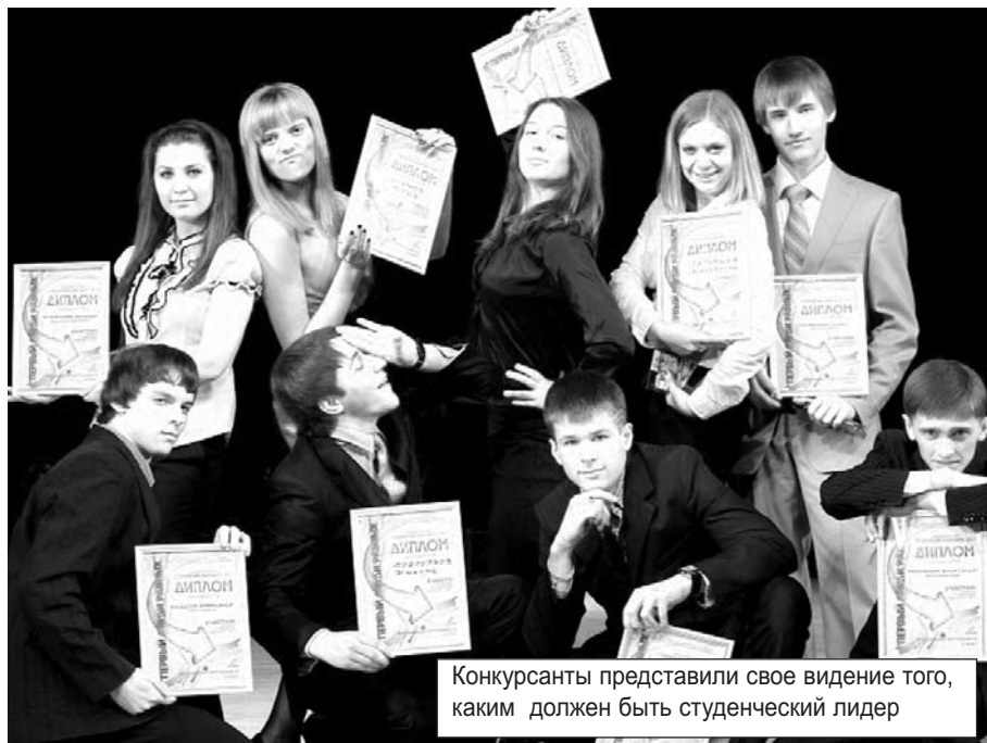
Конкурсанты представили свое видение того, каким должен быть студенческий лидер

27 апреля прошел конкурс профкома студентов «Студенческий лидер НИ ИргТУ». Десять участников постарались доказать жюри и зрителям, что именно они обладают наиболее ярко выраженными организаторскими способностями и лидерскими качествами