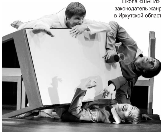
Школа «ШАГИ» – законодатель жанра в Иркутской области