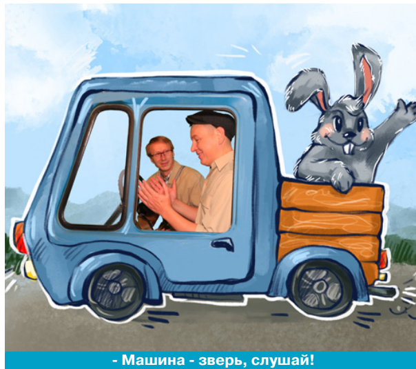
- Машина - зверь, слушай!

Предлагаем горячий фоторепортаж со съемочной площадки. Узнавайте в веселых киношных персонажах своих коллег, преподавателей и УЛЫБАЙТЕСЬ!!! Наш великий земляк для этого и жил, чтобы мы при любых обстоятельствах не разучились чувствовать добрую природу смеха и верили в самое лучшее.