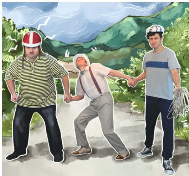
- Вы сюда приехали, чтобы записывать сказки, а мы здесь работаем, чтобы сказку сделать былью!